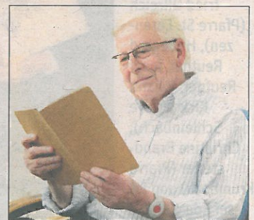
Notruftelefon: Für Ihre Sicherheit.

Infos unter ☎ 0800 800 408 oder www.hilfswerk.at . Werbung